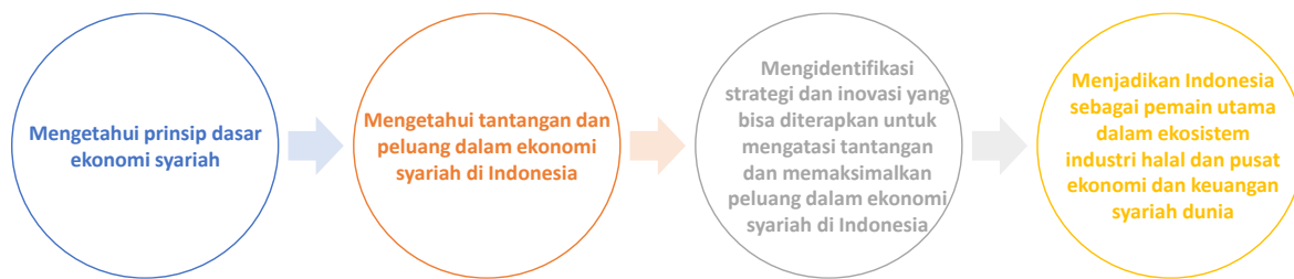
Gambar 2. Kerangka Pemikiran Penelitian

Berdasarkan gambar di atas maka kerangka penelitian pada artikel ini adalah mengeksplorasi tujuan dari penelitian yang terdiri dari Mengetahui prinsip dasar ekonomi syariah, Mengetahui tantangan dan peluang dalam ekonomi syariah di Indonesia, Mengidentifikasi strategi dan inovasi yang bisa diterapkan untuk mengatasi tantangan dan memaksimalkan peluang dalam ekonomi syariah di Indonesia. Sesuai dengan tujuan tersebut, maka artikel ini memberikan implikasi memberikan informasi yang komprehensif dan strategi yang dapat diterapkan untuk menjadikan Indonesia sebagai pemain utama dalam ekosistem industri halal dan pusat ekonomi dan keuangan syariah dunia.